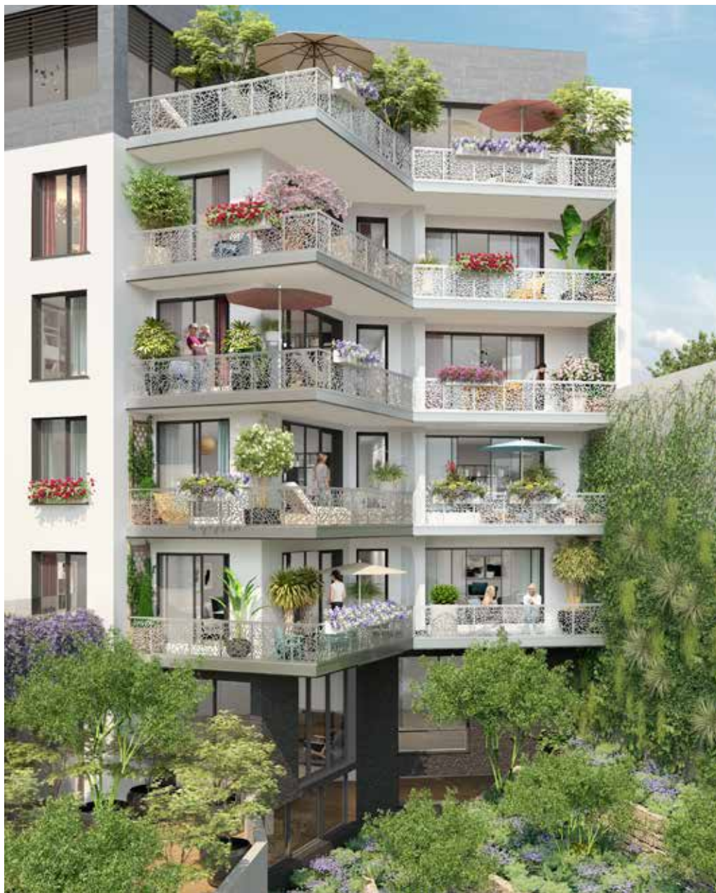
Côté jardin : un tableau de verdure offrant un panorama de détente