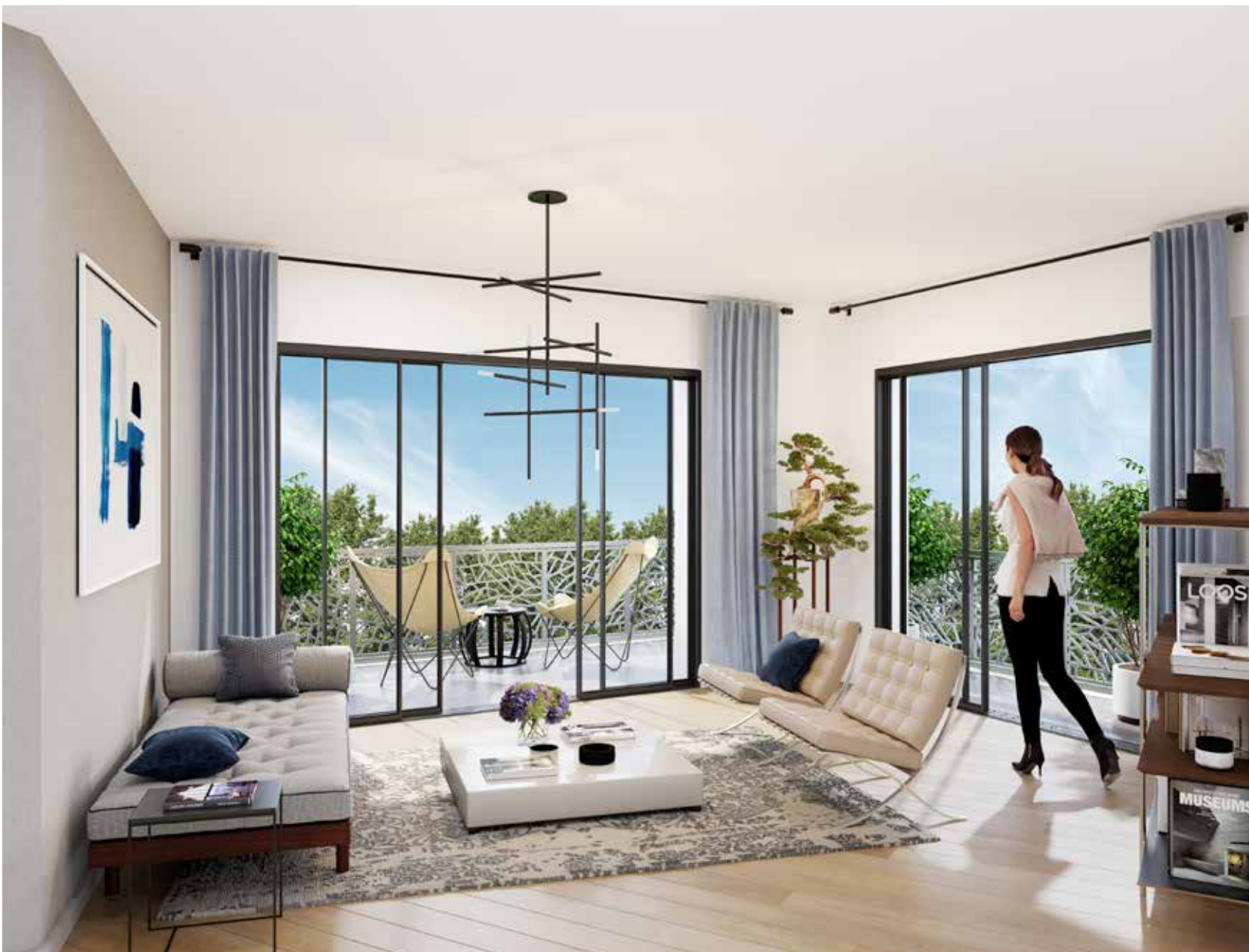
Le séjour d'un appartement de 4 pièces et son double balcon