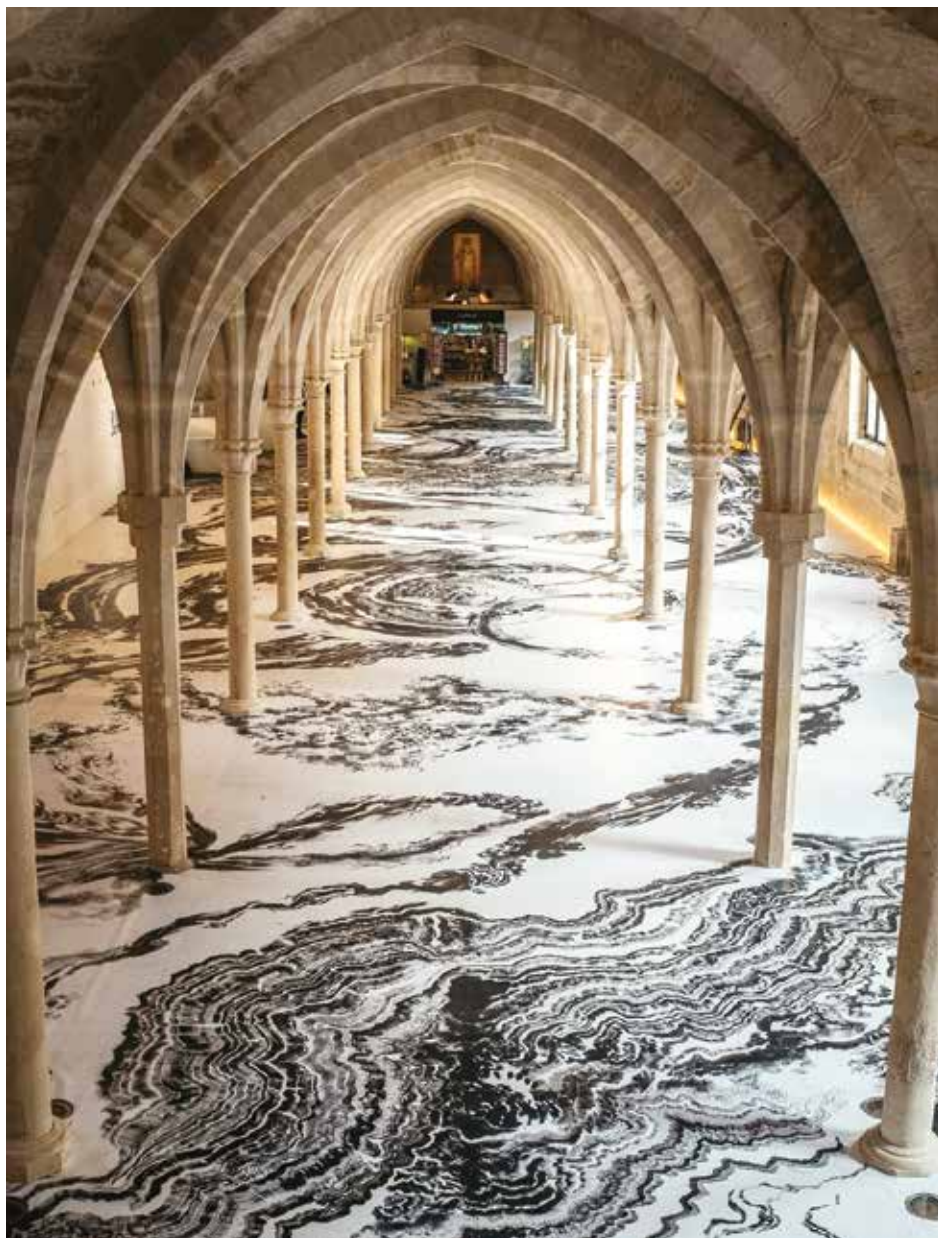
Abdelkader Benchamma, Echo de la naissance des mondes, Acrylique sur toile, 2018 - Collège des Bernardins, Paris

DANS LA CONTINUITÉ ET LA TRADITION ARTISTIQUE DE MONTPARNASSE :