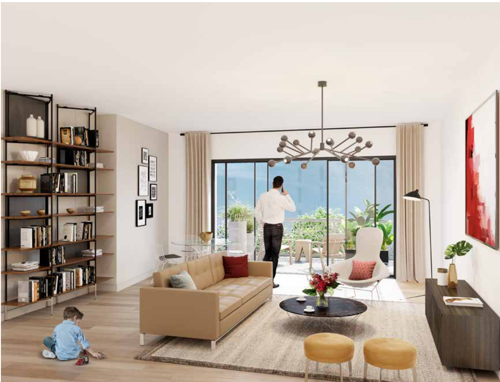
Les volumes généreux du séjour d'un appartement de 5 pièces, donnant sur le jardin