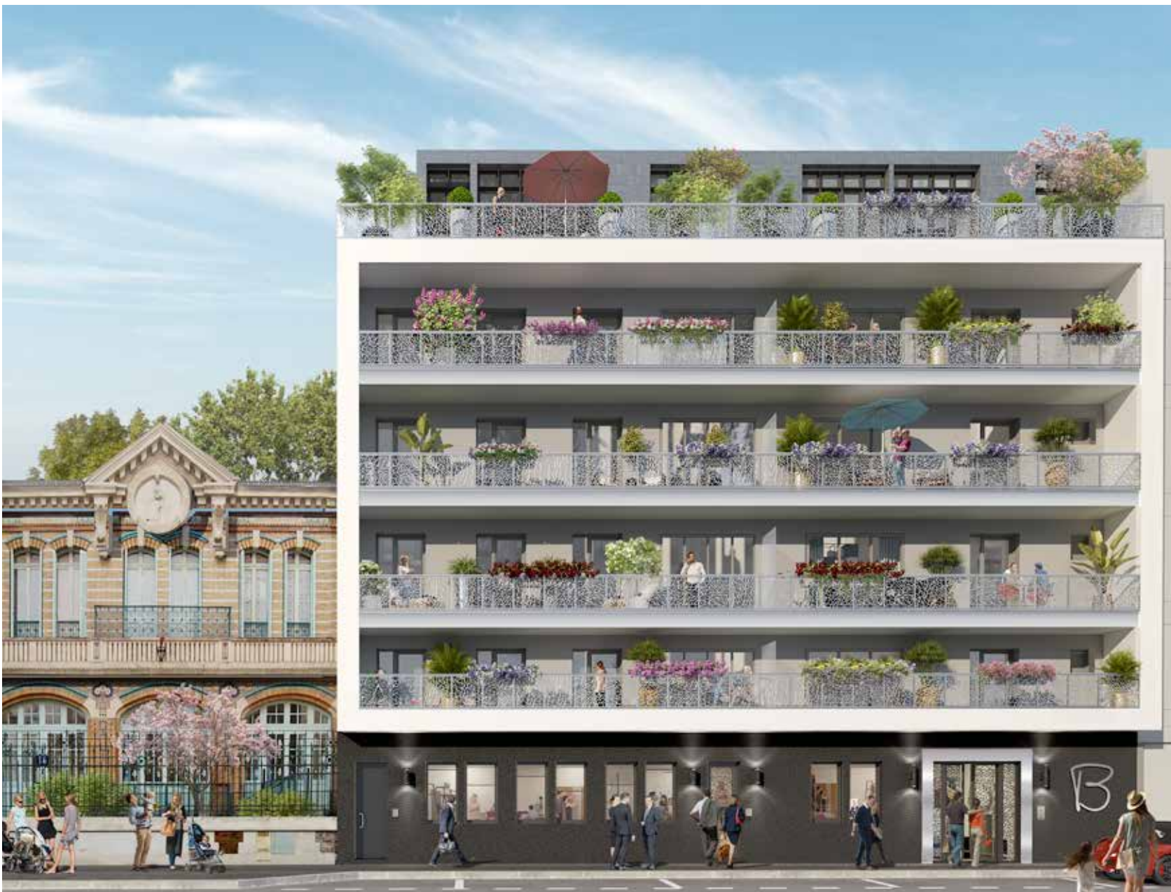
Côté rue : une façade élégante s'intégrant parfaitement dans son environnement