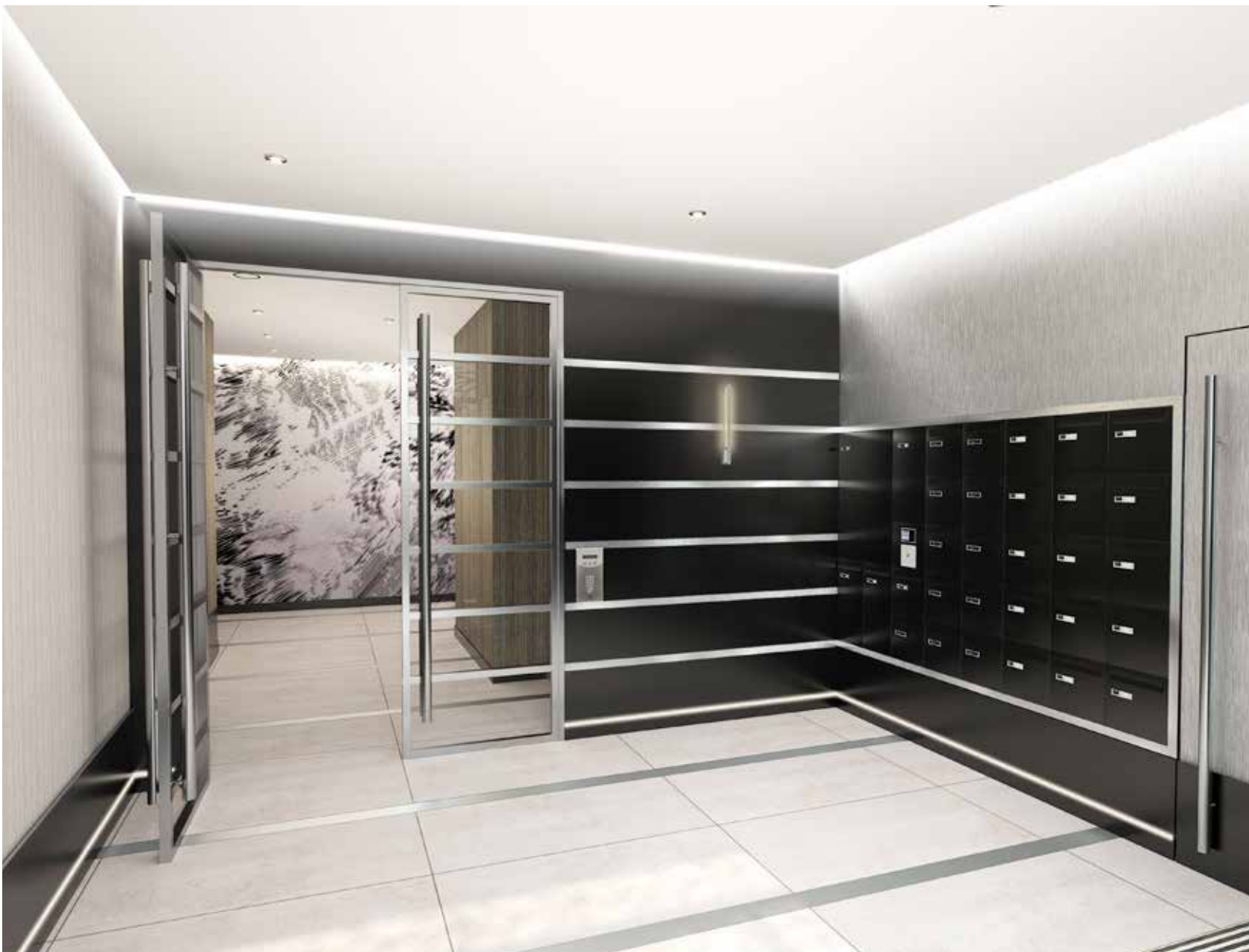
Une décoration soignée et une œuvre d'art originale sur-mesure pour un hall moderne et raffiné.