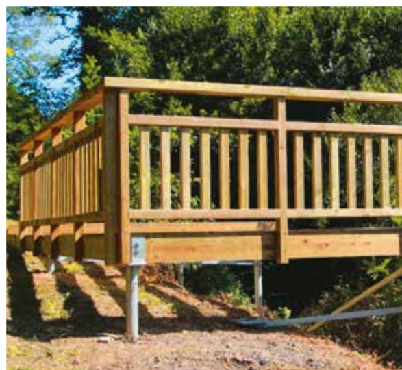
BELVÈDÈRES / PONTS