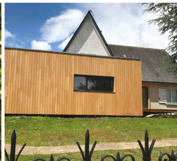
AGRANDISSEMENTS / VÉRANDAS / TERRASSES