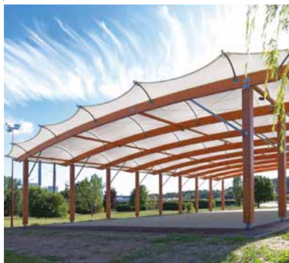
COUVERTURES DE TERRAINS