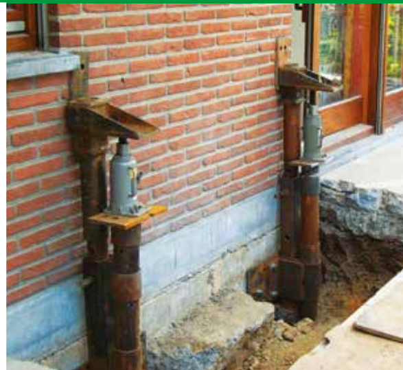
STABILISATION ET REDRESSEMENT DE FONDATIONS