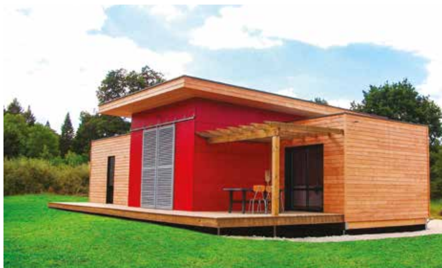
MAISONS OSSATURE BOIS