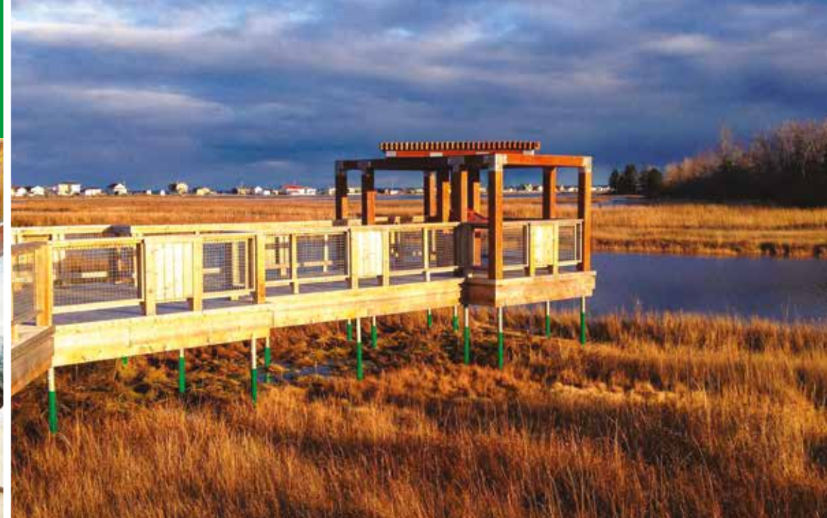
PASSERELLES / SENTIERS