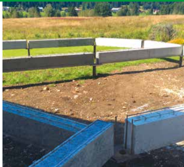
SUPPORTS LONGRINES BÉTON