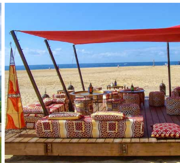
INSTALLATIONS SAISONNIÈRES / TEMPORAIRES