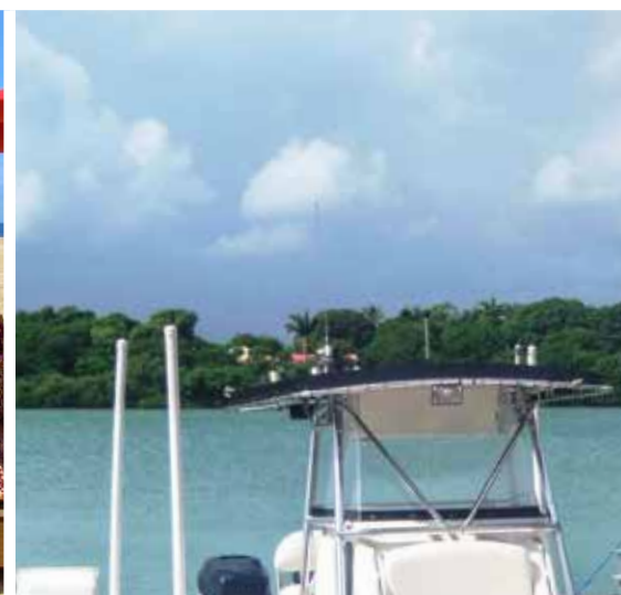
QUAIS / ASCENSEURS À BATEAUX