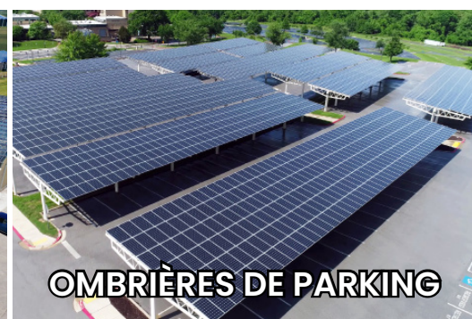
OMBRIÈRES DE PARKING