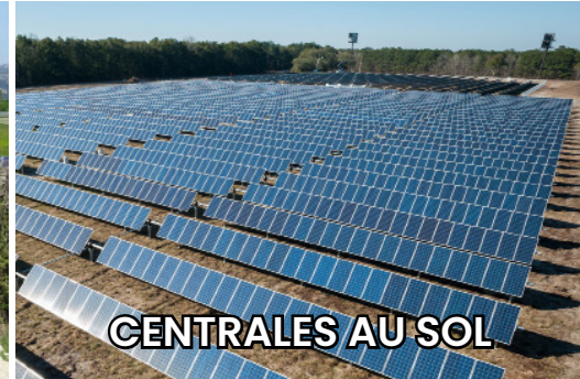
CENTRALES AU SOL