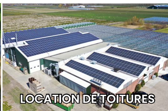
LOCATION DE TOITURES