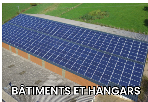
BÂTIMENTS ET HANGARS