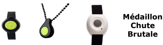
Médaille Chute Brutale

Étanche, à portée de main sur la personne 24h/24